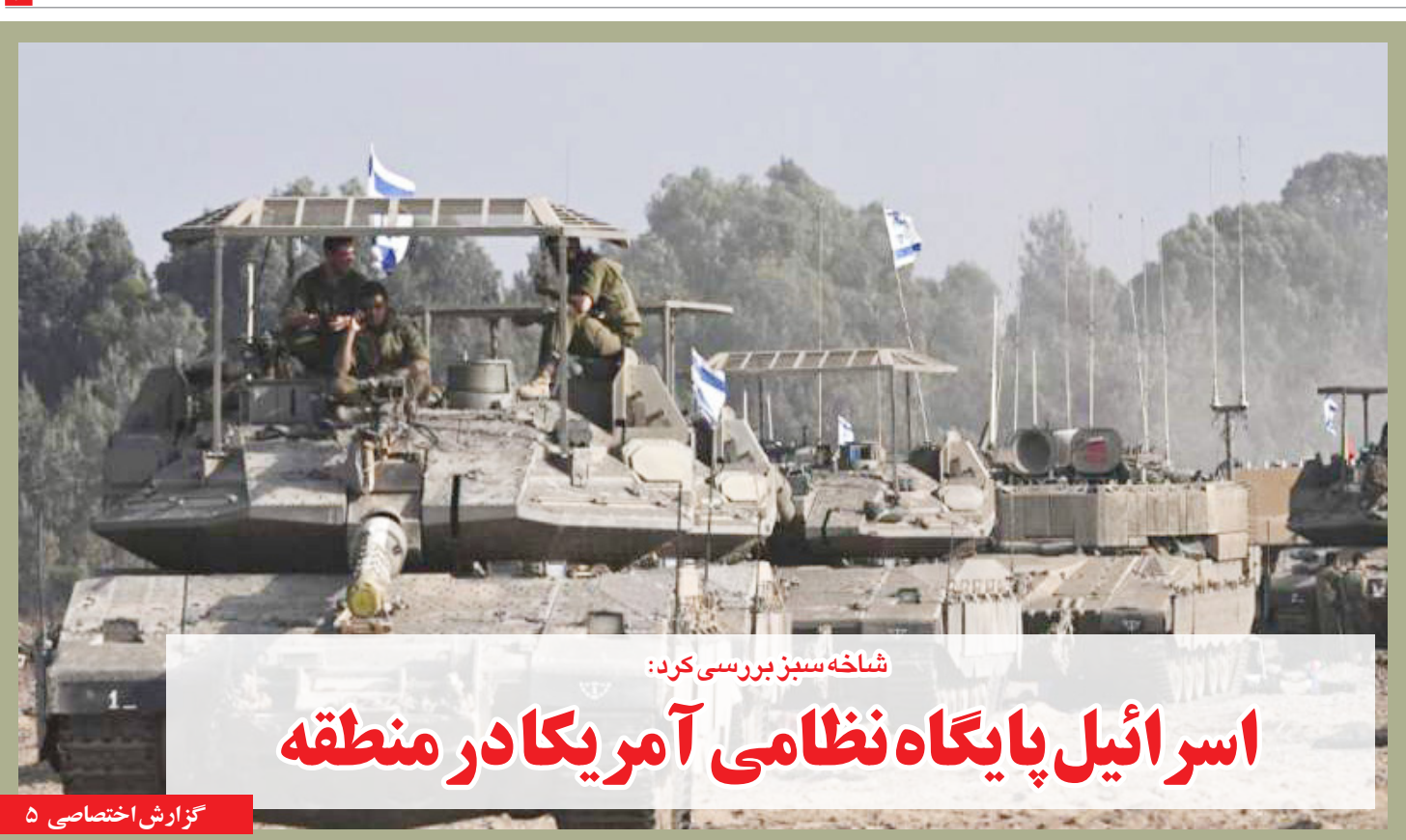
شاخه سبز بررسی کرد: