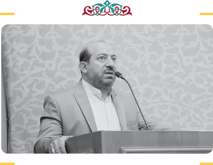
مساجد مرکز ثقل پشتوانه مردمی نظام هستند و مطمئناً دشمنان بر اهمیت و نقش مساجد در پیشبرد انقلاب اسلامی ملت ایران واقفند و قطعاً برنامه ریزی‌هایی می‌کنند تا مساجد از رونق بیفتند و نسل جدید با مساجد بیگانه باشند

از مجموع ۷۵ هزار مسجیدی که در کشور وجود دارد، نیمی از آنها امام جماعت ندارند و بسیاری از آنها هم که دارند هر سه وعده نماز را ندارند و یا اگر هم دارند، جمعیت ندارند!