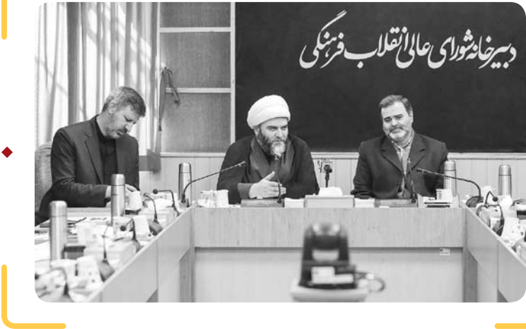
ما باید اسامی قاریان، حافظان و فعالان فرهنگی که در جوار مساجد زندگی می‌کنند در اختیار دوستان قرار دهیم و این افراد به مساجد دعوت شوند و نشست‌ها و کرسی‌های تلاوت با حضور آن‌ها برگزار شود