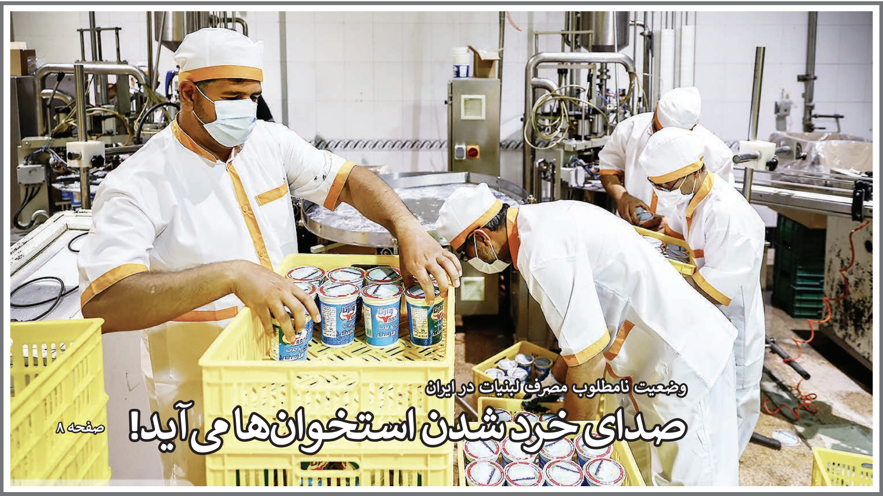
وضعیت نامطلوب مصرف لبنیات در ایران