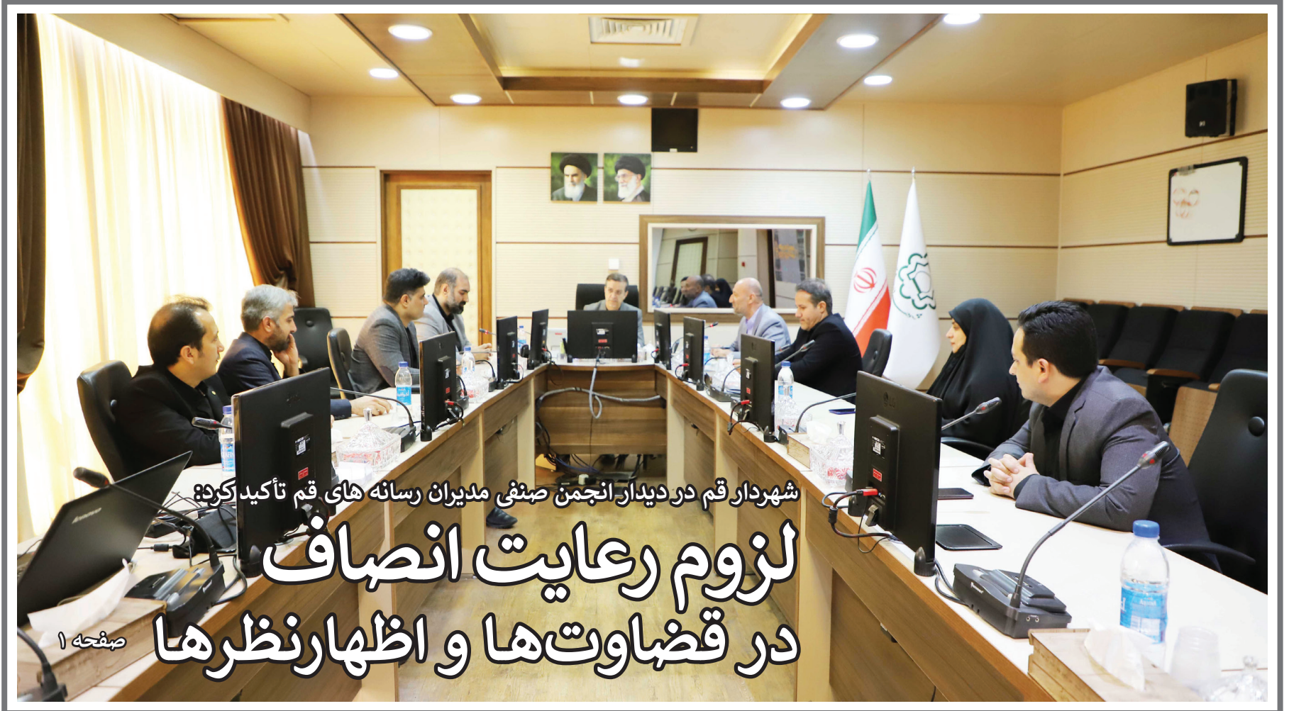
شهردار قم در دیدار انجمن صنفی مدیران رسانه های قم تأکید کرد:

لزوم رعایت انصاف در قضاوت‌ها و اظهارنظرها