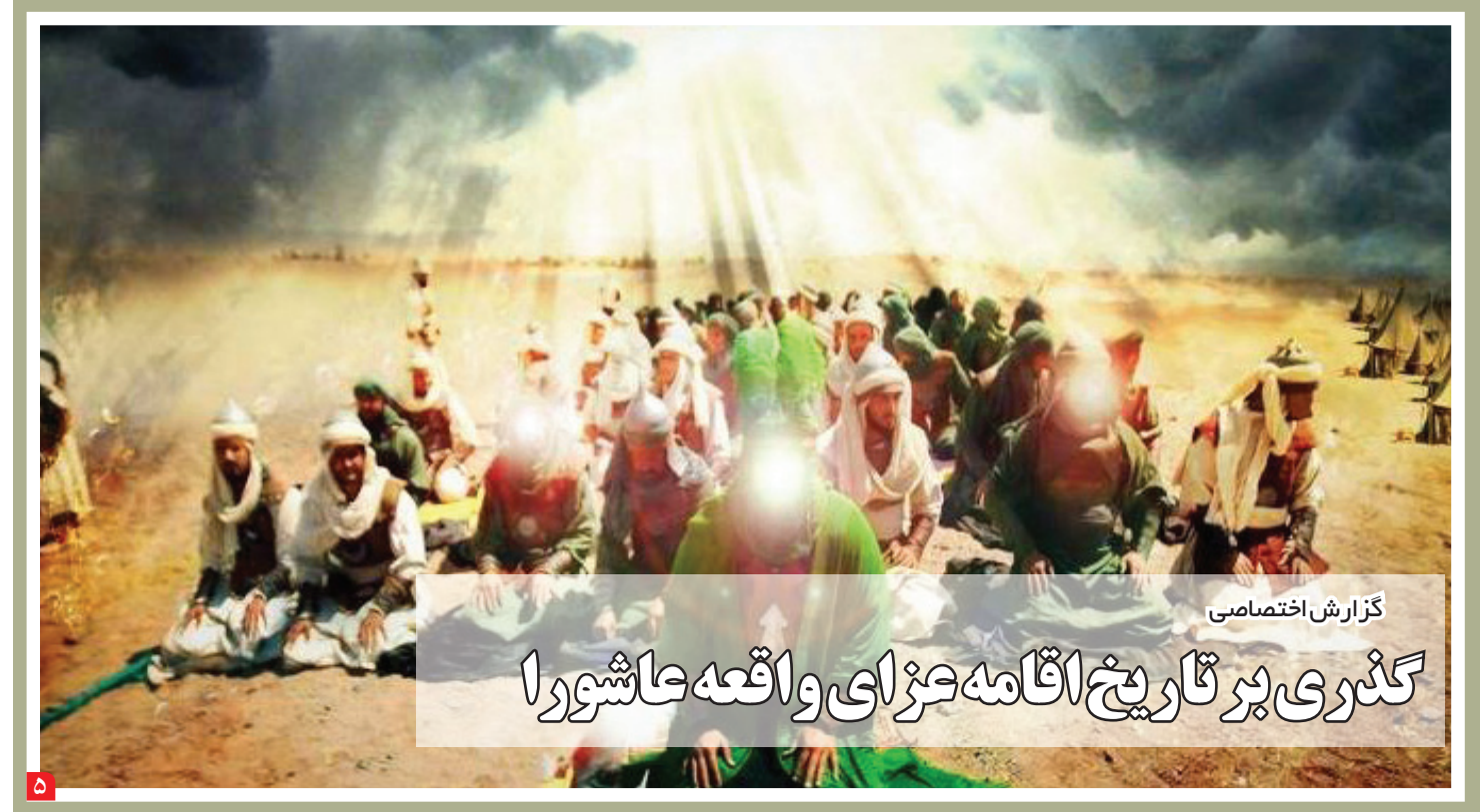
گزارش اختصاصی گذری بر تاریخ اقامه عزای واقعه عاشورا