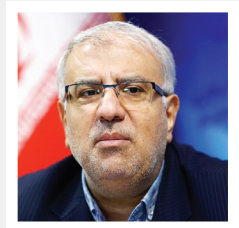
در حاشیه جلسه هیئت دولت