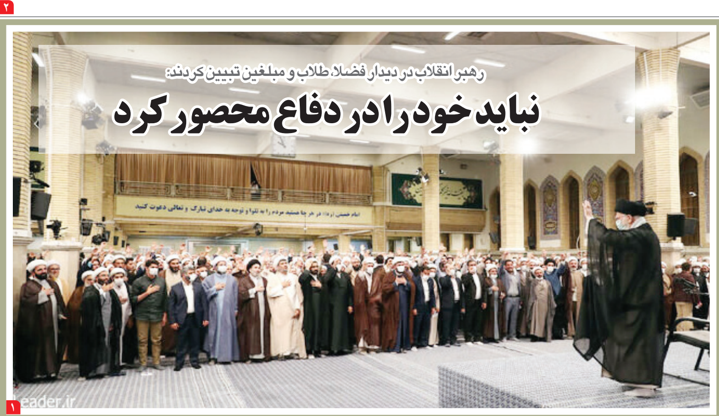
رهبر انقلاب در دیدار فضلاء طلاب و مبلغین تبیین کردند: