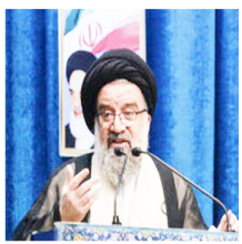
در نماز جمعه تهران:

آیت الله خاتمی: عامل و مسبب مسمومیت دانش آموزان، حکمشان اعدام است