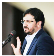
وزیر راه و شهرسازی:

مصمم به تکمیل مسکن مهر در سال ۱۴۰۲ هستیم