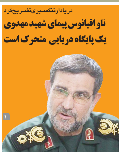
دریادار تنگسیری تشریح کرد ناو اقیانوس پیمای شهید مهدوی یک پایگاه دریایی متحرک است

رئیس انجمن تامین کنندگان فرآورده های خام دامی اعلام کرد