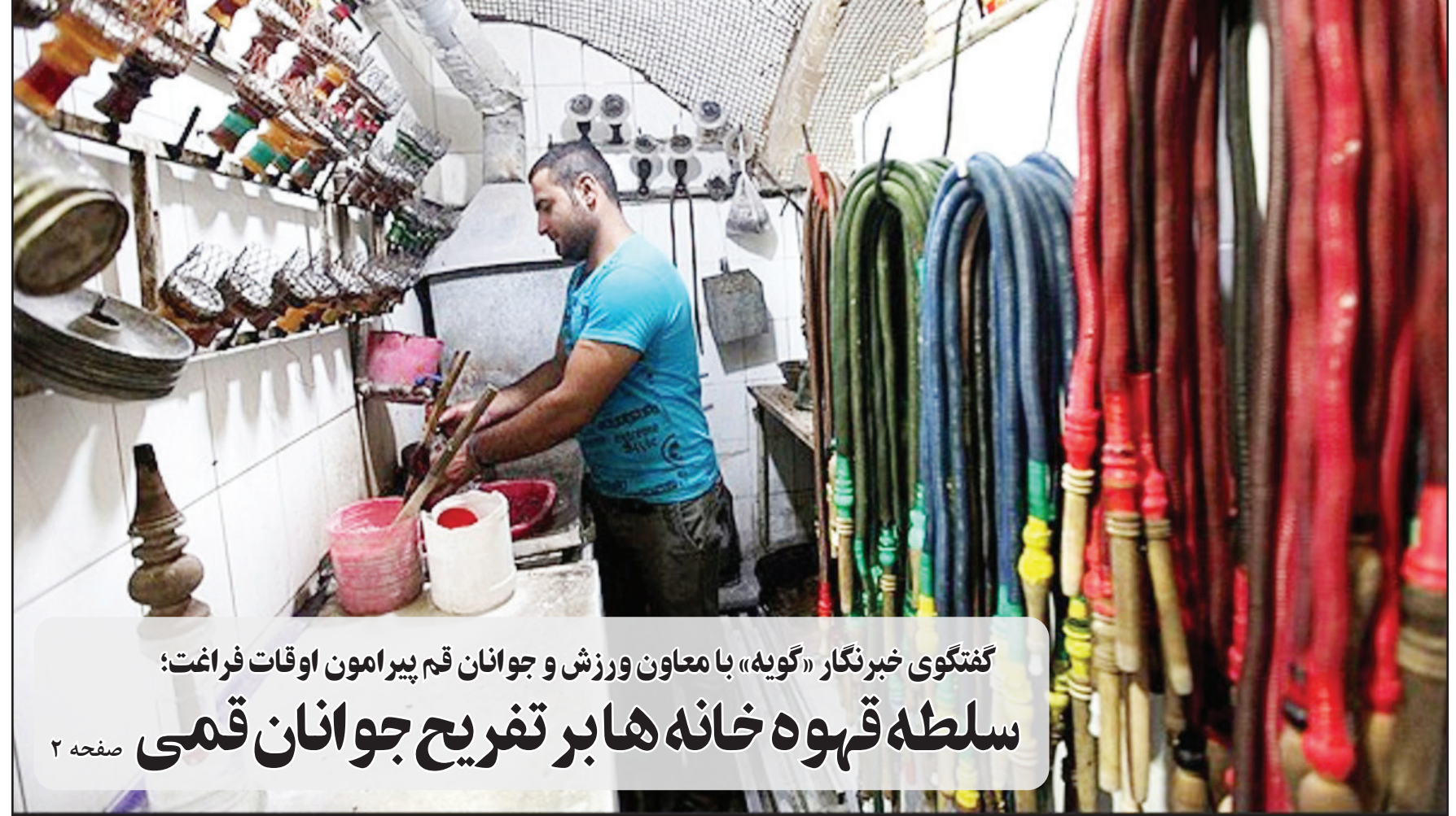
گفتگوی خبرنگار «گوپه» با معاون ورزش و جوانان قم پیرامون اوقات فراغت؛ سلطه قهوه خانه‌ها بر تفریح جوانان قمی صفحه ۲