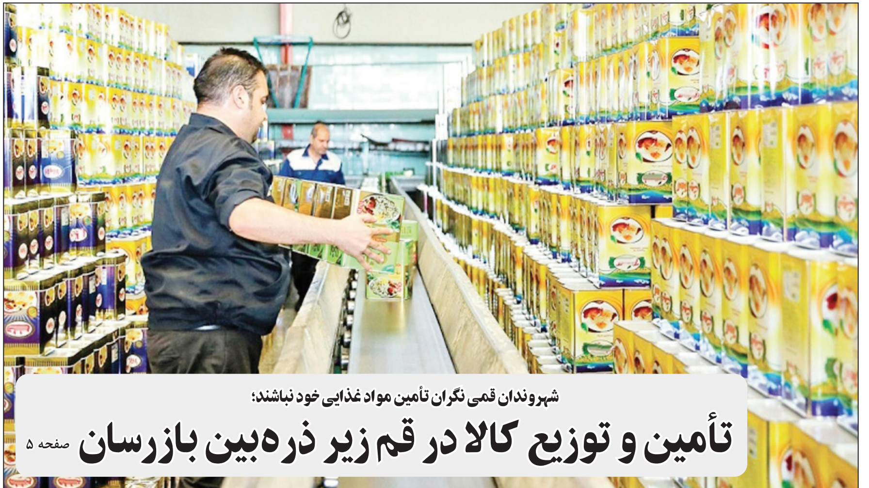
شهروندان قمي نگران تأمين مواد غذايي خود نباشند: