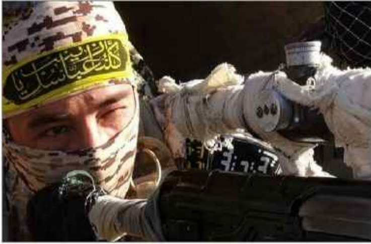
صدای تیراندازی که فروگوش کرد صدای چند نفر دیگر که بی‌نهایت با سیدم که دست خود را آلوده نمودند

نای سرد بودند که دو تیر خلاصی پشت گردنم زدند و دیگران حال رفتیم