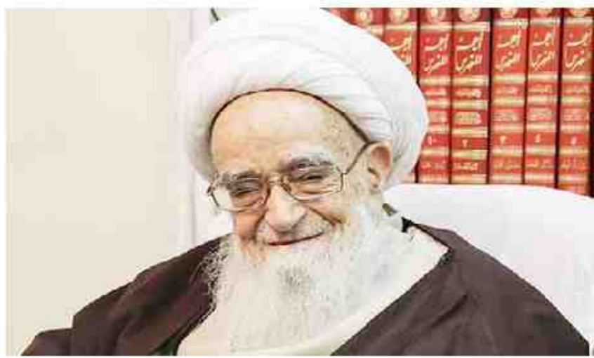
ایشان نیکو دلستن موجب آبادی سرزمین ها و طولانی شدن عمرها می شود

نیکویی به پدر و مادر و صلح ارحام نیز یکی از عوامل مهم در طول عمر انسان است که در این رابطه رسول اکرم (ص) فرموده اند: «بَيْنَ اَدَمَ لَبْرٍ وَالدُّنْيَا وَجَلِّ رَحِمَكَ، يُبَشِّرُ لَكَ بَشْرَكَ وَتَمُدُّ لَكَ فِعْرَكَ» ای فرزند آدم! به پدر و مادرت نیکویی کن و صلح رحمت داشته باش تا خدا کارت را درایت لسان و عمرت را طولانی نماید.