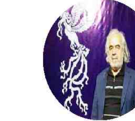
مالک بردیس سینمایی شهر آفتاب قم عنوان کرد