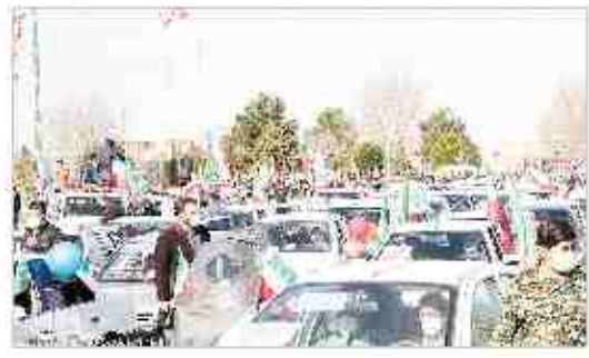
جشن سالگرد پیروزی انقلاب اسلامی

شش هزار و ۳۰۰ رأی‌دهنده در تهران و سایر مراکز استان‌ها و شهرستان‌ها در جریان رأی‌دهی شرکت کردند. در این انتخابات ۹۳۰ صبح به وقت محلی رأی‌دهی آغاز شد.