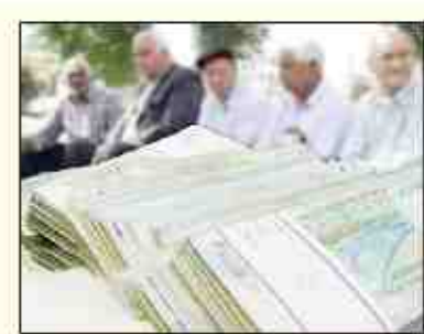
مجلس شورای اسلامی

فرمانده نیروی دریایی ارتش گفت: ایستادگی ملت ایران در بیش از ۴ دهه از عمر انقلاب شکوهمند اسلامی ایران، موجب اقتدار کشور شده است. به گزارش ایلتنا، امیر دینار شهبان امیر نیروی دریایی ارتش جمهوری اسلامی ایران در دوره شش‌ماه‌ای معارف جنگ شهبان سپید صیاد شیرازی که در دانشگاه علوم و فنون هوایی شهید ساری نیروی هوایی ارتش برگزار شد، ضمن تبریک روز نیروی هوایی ارتش، با بیان اینکه دوران دفاع مقدس موجب رشد و بالندگی ایران اسلامی در تمامی عرصه‌ها شده است، گفت: امام راحل با یک مندر بهت جمع و هدایت به منبع موجب پیروزی تاریخ‌ساز انقلاب شکوهمند اسلامی شدند و پس از آن هم دوران دفاع مقدس را با وجود تمامی سختی‌ها با افتخار پشت‌سر گذاشتیم. وی با بیان اینکه ایستادگی ملت ایران در طول انقلاب اسلامی موجب اقتدار کشور شده است تصریح کرد: هرگاه ایرانی‌ها از هوش و استعداد خود در کارهای مهم‌تر دورند در دنیا سرآمد خواهند بود. فرمانده نیروی دریایی ارتش با بیان اینکه نیروی دریایی همواره در کنار نیروی هوایی ارتش دولتی عملیات‌های زیادی را به خوبی مدیریت کند و به سرانجام برسد، خطاب به دانشجویان گفت: مطمئن باشید دشمن خیلی حقیر است و در برابر شما هیچ حرفی برای گفتن ندارد. شما دانشجویان عزیز باید دانش و علوم و فنون روز را به خوبی فرا بگیرید.