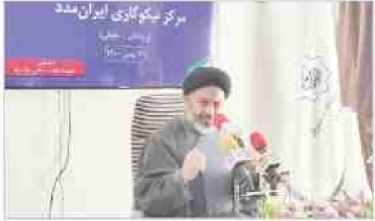
مرکز نیکوکاری ایران مدد

به دلیل عدم استفاده از کادر مجامع حقوقی باعث بلااستفاده ماندن از ظرفیت و کلاهشده است هدف ما تأسیس مرکز نیکوکاری کمکیه کاهش جرایم کیفری و گسستن تعداد پرونده‌ها در مجامع قضائی است، چرا که اکنون طبق آخرین آمار یک میلیون و پانصد هزار پرونده در مجامع قضائی استانی متراکم وجود دارد.