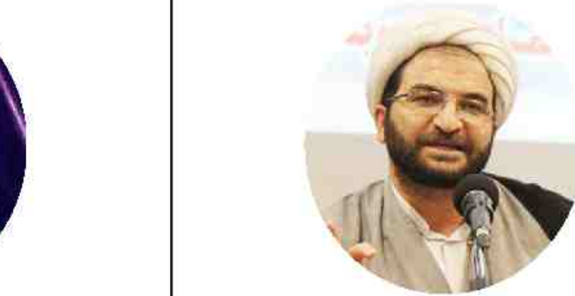
معاون پژوهشی دانشگاه ادیان و مذاهب: